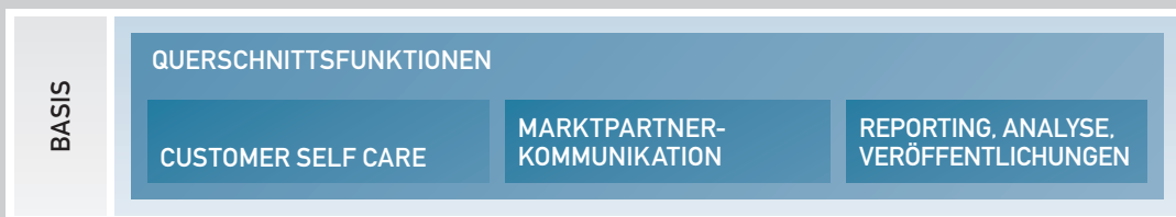
Abb. Lösungsportfolio MTS TRADE

MTS TRADE stellt eine Komplettlösung zur soliden Abbildung aller Handelsprozesse dar und überzeugt durch eine einheitliche Systembasis und offene Schnittstellen. Diese sind Voraussetzung für die einfache Anpassung an neue Marktregeln sowie eine einheitliche marktübergreifende Bilanzierung.