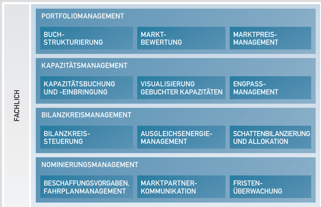
Abb. Lösungsportfolio MTS TRADE

Mit MTS TRADE erhalten Erdgashändler und Bilanzkreismanager ein standardisiertes Handelssystem, das einfach und flexibel kundenindividuell angepasst werden kann. Dabei steht ECG als kompetenter Lösungspartner von der Konzeption über die Realisierung bis hin zum Betrieb stets zur Seite.